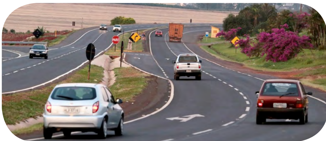
Sanções para gestores e empreiteiros que incorrerem em irregularidades

O Tribunal de Contas vai conferir a qualidade do asfalto utilizado na pavimentação de ruas e estradas do Paraná, em obras pagas por prefeituras, governo estadual e concessionárias de rodovias pedagiadas. Numa fiscalização piloto, realizada no município