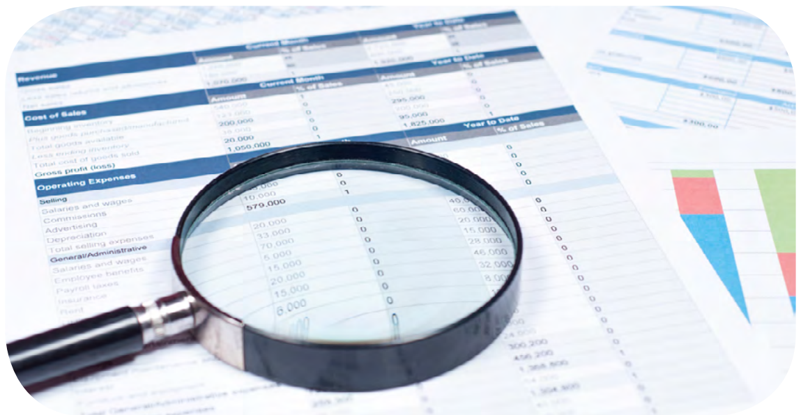
Entre setembro de 2016 e março de 2017, economia foi de R$ 382,9 mi

mento Econômico (OCDE), o conluio de empresas pode gerar, em média, um sobrepreço de 10% a 20%.