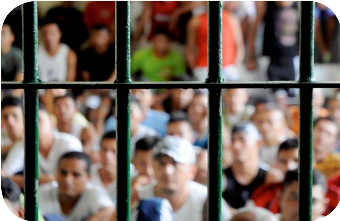
Cerca de 9 mil presos estão amontoados em 174 cadeias e carceragens

A outra medida imediata recomendada pelo TCE-PR é que o governo estadual redirecione recursos do empréstimo de US$ 112 milhões, concedido pelo Banco Interamericano de Desenvolvimento (BID), para a