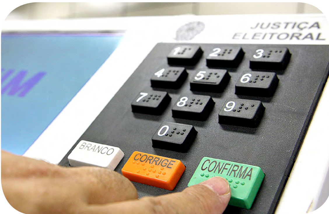
Julgamentos são apoiados em pareceres técnicos

contra esses políticos são condenações por irregularidades em mandatos anteriores, improbidade administrativa, compra de votos e abuso do poder econômico.