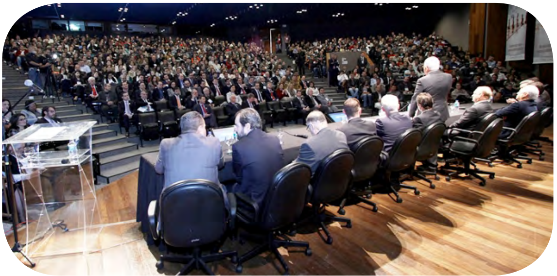
Presidente Durval Amaral

Com palestra do ministro do Superior Tribunal de Justiça Sérgio Kukina, o TCE encerrou, na tarde do dia 29 de junho, o 2º Fórum de Controle Externo. Durante dois dias, o evento debateu os principais temas da administração pública: licitações e contratos, contabilidade e orçamento, auditoria, transferência voluntária de recursos, controle interno, transparência e controle social, atos de pessoal e obras.