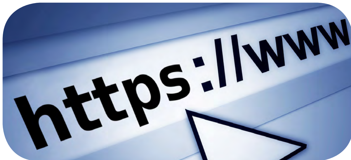
O ato de alerta ficará disponível no Sistema Gerenciador de Acompanhamento – SGA

A medida atende as disposições do Artigo 286-A do Regimento Interno do TCE. O ato de alerta ficará disponível para leitura e ciência no Sistema Gerenciador de Acompanhamento – SGA, junto ao site do TCE-PR . Cabe exclusivamente ao representante legal o registro de ciência de leitura do referido ato.