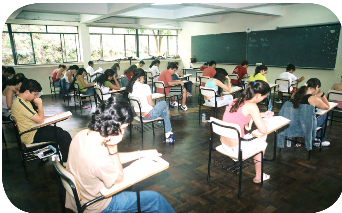
Custo por aluno seria de R$ 9 mil, aponta estudo preliminar